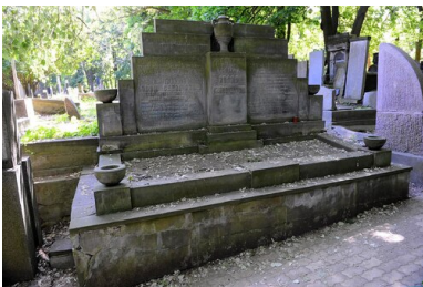
Grobowiec rodziny Czerniaków na cmentarzu żydowskim przy ulicy Okopowej w Warszawie