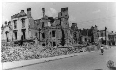
Zniszczenia wojenne w Jaśle, 1946 r.

Do getta jasielskiego trafili także Żydzi z okolicznych miejscowości, m.in. Frysztaka, Jedlicza i Kołaczyc. Pewna grupa Żydów trafiła też do niemieckiego obozu pracy w Szebniach. Według niektórych źródeł getto utworzono już w drugiej połowie 1941 r. – miało ono wówczas charakter otwarty. Założono je w okolicach dawnego placu targowego, powszechnie nazywanego „targowicą”. Była to raczej uboższa część miasta, o słabej infrastrukturze. Na relatywnie niewielkim obszarze, skomasowano ok. 3 tys. osób, co dodatkowo pogarszało i tak trudne warunki egzystencji. Po zamknięciu bram getta, kiedy dzielnicę tę można było opuścić za specjalnym pozwoleniem, warunki te uległy dalszej degradacji. Szerzyły się głód i choroby.