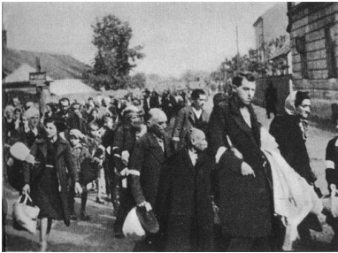
Deportacja Żydów rzeszowskich do obozu w Bełżcu, 1942 r. (domena publiczna)

wyłapywali ukrywające się osoby, a następnie eskortowali je na miejsce zbiórki. Zdarzało się, że część osób rozstrzelano na miejscu. Na placu zbiorczym dokonywano rewizji, a także selekcji. Niewielką grupę, ok. 200 osób, pozostawiono do porządkowania terenu getta.