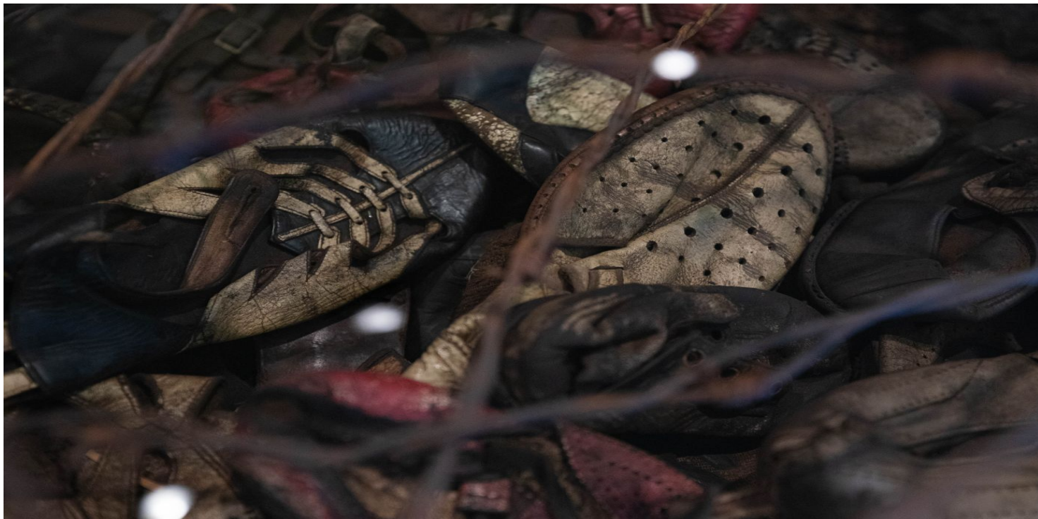
Muzeum i Miejsce Pamięci w Bełżcu.

https://przystanekhistoria.pl/pa2/tematy/zydzi/93533,Starzy-i-mlodzi-chorzy-i-dzieci-wszyscy-z-tobolkami-Zagl-ada-jasielskich-Zydow.html