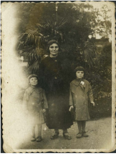
Stopniccy Żydzi

między innymi w dwóch domach modlitwy. W jednym mieszkało 110 osób, w drugim zaś 40. Tylko w jednym budynku umieszczono łóżka. Z powodu głodu, do czerwca 1941 r. zmarło 400 osób. Ze względu na ścisk i kiepskie warunki sanitarne, w getcie wybuchł dur plamisty.