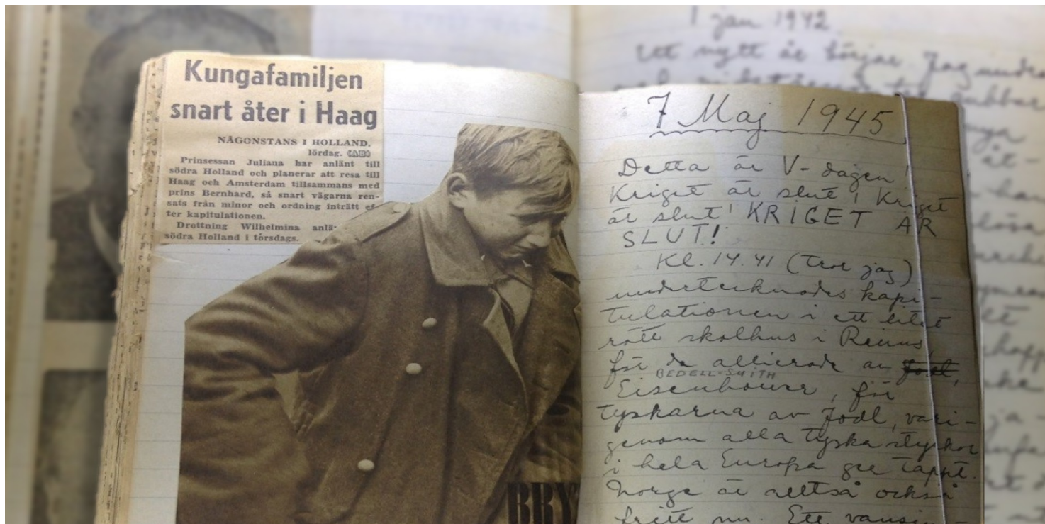
Wklejone do zeszytu wycinki prasowe. Obok odręczny zapis pod data 7 maja 1945 r.

https://przystanekhistoria.pl/pa2/tematy/zydzi/70962,Polska-w-latach-II-wojny-swiatowej-oczami-Astrid-Lindgren.html