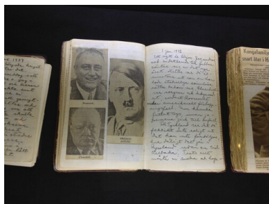
Przykładowe karty z „dziennika wojennego” eksponowane podczas wystawy „The whole world is on fire”.

Opisywanie dramatycznych losów II wojny światowej rozpoczęła 1 września 1939 r. W oparciu o informacje głównie dostarczane przez prasę i radio stworzyła obraz Szwecji i życia codziennego szwedzkiej rodziny w dobie konfliktu międzynarodowego. Każdego roku, kilka razy w miesiącu, przedstawiała wydarzenia wojenne i wielką, światową politykę dołączając do wpisów wycinki prasowe z artykułami, mapami i zdjęciami. Nadto, po roku od wybuchu wojny, cennym źródłem informacji do jej opisu stały się listy wojskowe i prywatne z zagranicy, do których dostęp uzyskała w związku z podjęciem pracy w tajnej cenzurze korespondencji. Stąd w „Dziennikach” znaleźć można cytaty stanowiące „wstrząsające świadectwa cywili, których dosięgła wojna”. A „dosięgła” ona przecież i Polaków. Stąd pojawia się pytanie o Polskę w świetle relacji Lindgren.