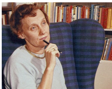
Astrid Lindgren, 1960 r.

Ostatnie wpisy dotyczące Polski to styczeń i maj 1945 r., w których odnotowała „uwolnienie” od Niemców Warszawy i zajęcie Bornholmu przez Rosję, co czyniło w jej opinii „kwestię Polską” trudną, dodając przy tym odpis listu z okresu pracy w cenzurze korespondencji i wymowne zdanie: Boję się Rosjan . Z tych kilku wzmianek o Polsce, poza smutnym wizerunkiem kraju ogarniętego wojną, przebija się bunt autorki przeciwko totalitaryzmom Hitlera i Stalina, które do tego doprowadziły i współczucie dla ich ofiar. Oskarżeniom kierowanym pod adresem rządzących Niemcami i Rosją towarzyszy w „Dziennikach” niejako wstyd za pozorną neutralność Szwecji.