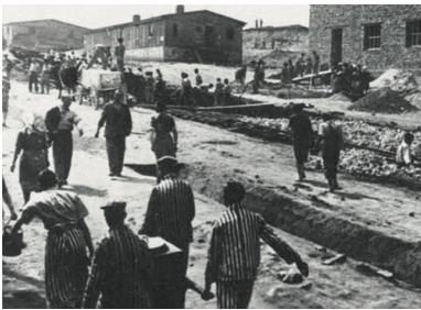
KL Płaszow bei Krakau - niemiecki nazistowski obóz pracy przymusowej w Płaszowie

Po czerwcowej deportacji Żydów zmniejszono obszar getta krakowskiego – 20 czerwca 1942 r. odcięto ulice Czarnieckiego, Rękawka, św. Benedykta, oraz południowe odcinki ul. Krakusa i Węgierskiej. Pozostali w dzielnicy mieszkańcy przystąpili do ponownego organizowania życia. Otwarte zostały te instytucje, z których wywieziono ludzi, jak np. szpitale czy ochronki dla dzieci. Nastąpił drugi okres adaptacji w żydowskiej dzielnicy mieszkaniowej.