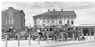
Plac Zgody (obecnie Plac Bohaterów Getta) w 1931 r.

którzy nie otrzymali pieczętek „na życie”, jak je później określano w relacjach. Do transportów w pierwszej kolejności skierowano głównie starszych, chorych, a także kobiety ciężarne i z dziećmi. Nierzadko deportowano kilka osób z jednej rodziny.