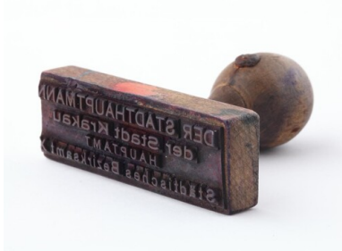
Pieczętka niemieckiego starosty miasta Krakowa używana przez PPS do fałszowania dokumentów, 1939-1944 r.