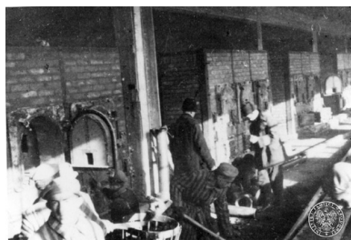
Piece krematoryjne na terenie Birkenau, 1942-1943 r.