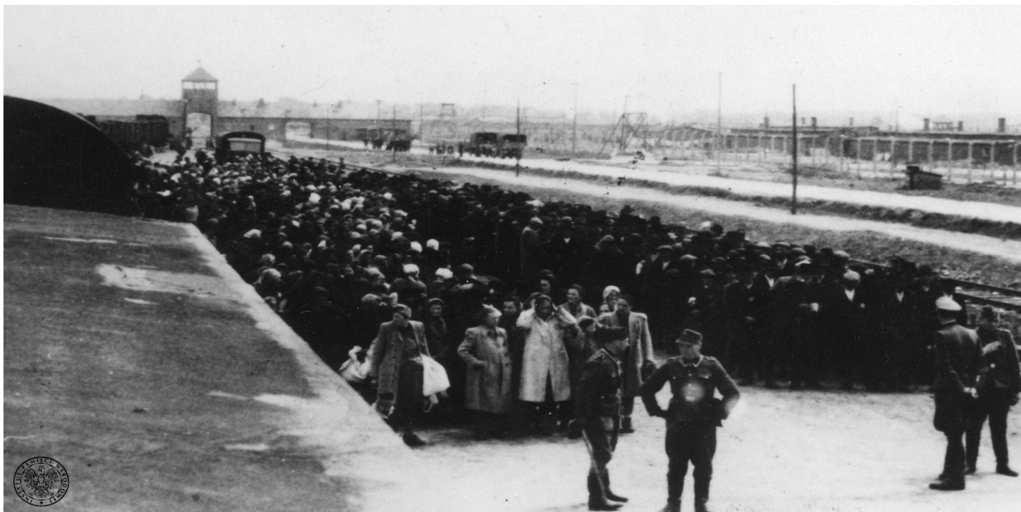
Selekcja transportu więźniów na rampie boczniczy kolejowej w obozie zagłady KL Auschwitz-Birkenau, maj 1944 r.

https://przystanekhistoria.pl/pa2/tematy/zsrs/95874,Auschwitz-a-front-wschodni.html