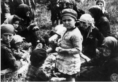
Grupa kobiet i dzieci z transportu Żydów z Węgier, uznanych za niezdolne do pracy, czeka na śmierć w pobliżu komór gazowych obozu zagłady KL Auschwitz-Birkenau, maj 1944 r.

Naloty z pewnością przyniosłyby liczne ofiary wśród więźniów, ale uratowałyby, jak sędzę, setki tysięcy istnień ludzkich.