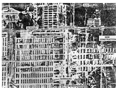
Zdjęcia lotnicze obozu koncentracyjnego KL Auschwitz-Birkenau wykonane przez lotnictwo amerykańskie, 25 sierpnia 1944 r.

Kolejne zdjęcia wykonano 25 sierpnia tego roku. Na rampie znajdowały się 33 wagony, a 1500 osób zmierzało do krematorium nr II.