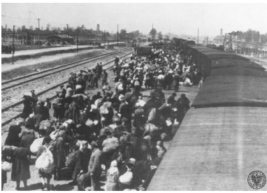
Selekcja transportu więźniów na rampie boczniczy kolejowej w obozie zagłady KL Auschwitz-Birkenau, 27 maja 1944 r.

„12 września 1944 organizacja ruchu oporu w obozie KL Auschwitz-Birkenau przekazała meldunek: »Jeszcze obecnie przychodzą transporty żydowskie ze wschodu«”.