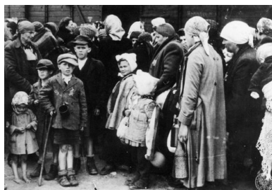
Kobiety i dzieci z transportu Żydów z Węgier na rampie boczniczy kolejowej w obozie zagłady KL Auschwitz-Birkenau, maj 1944 r.

Od końca sierpnia 1944 roku, po zajęciu Paryża, możliwe stały się loty z Francji, ale odległość od obozu niewiele się zmniejszyła. Wynosiła ona 1225 km.