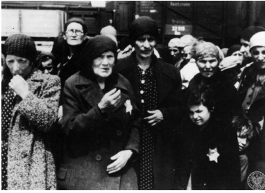
Kobiety z dziećmi z transportu Żydów z Węgier na rampie boczniczy kolejowej w obozie zagłady KL Auschwitz-Birkenau, maj 1944 r.