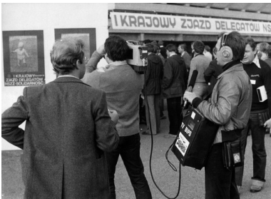
Operatorzy TV BIPS (Biuro Informacji Prasowej KKP NSZZ „S”) przed wejściem na halę widowiskowo-sportową "Olivia" w Gdańsku, gdzie odbywał się I Krajowy Zjazd Delegatów Niezależnego Samorządnego Związku Zawodowego "Solidarność", 1981 r.

Rosji, Białorusi, Ukrainie. Wytłumaczył mi wiele meandrów życia w ZSRS, przybliżył liczne wątki tamtejszych tradycji. Kiedyś powiedział mi, że z punktu widzenia »ludzi sowieckich« polski sprzeciw wobec komunizmu może być całkiem niezrozumiały. W polskich sklepach można było bowiem dostać artykuły u nich zupełnie nieznane. W zasadzie wszystkie standardy były w Polsce wyższe od ZSRS... Zakres swobód obywatelskich też był u nas nieporównywalny z realiami Sowietów. Zupełnie nieporównywalne były również formy ucisku. W Polsce, w gronie krewnych czy znajomych, wszędzie swobodnie można było wymieniać myśli. Na Wschodzie coś takiego mogło się wiązać z prawdziwym ryzykiem. Rozmawialiśmy też o perspektywach rozpadu Związku Sowieckiego. Wtedy właśnie pierwszy raz spotkałem się z poglądem, że jeśli dojdzie do rozkładu tego mocarstwa, to przyczyną będą kwestie narodowościowe” 1 .