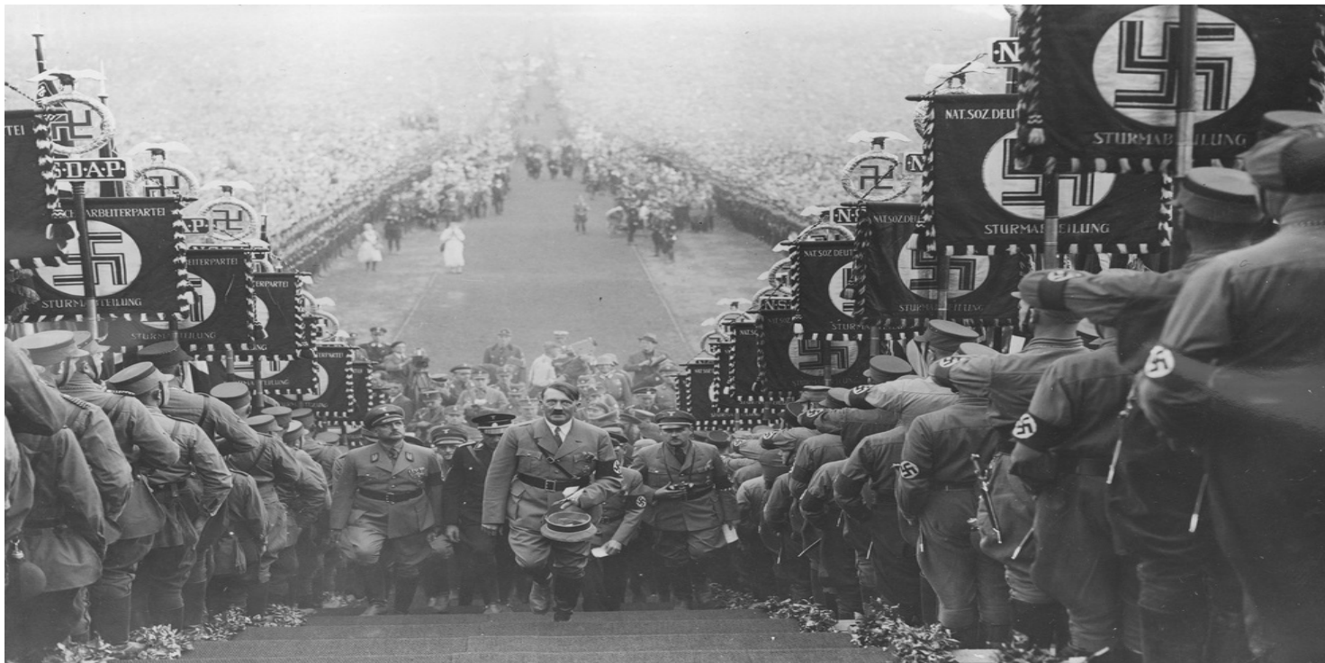
Adolf Hitler podczas uroczystości dożynkowych w otoczeniu oficerów wchodzi na górę Buckeberg pod Hameln przez szpaler utworzony z partyjnych sztandarów. Na drugim planie widoczny wielotysięczny tłum, 30 września 1934 r.

https://przystanekhistoria.pl/pa2/tematy/zsrs/85789,Droga-do-wojny.html