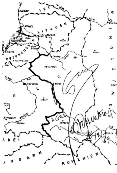
Mapa podziału Polski pomiędzy III Rzeszę a ZSRS z 28 września 1939 r. z wytyczoną granicą.

Zarówno Hitler jak i Stalin mieli pełną świadomość, że po osiągnięciu linii demarkacyjnej oba totalitarne państwa będą ze sobą graniczyć, a ich starcie – prędzej czy później – będzie nieuniknione. Przemawia to za tymczasowym charakterem ich porozumienia. Krzykliwe nagłaśnianie przez propagandę obu państw przyjaźni niemiecko-sowieckiej nie świadczy o rzeczywistych intencjach żadnego z dyktatorów i przez społeczeństwa obu państw było przyjmowane z niedowierzaniem. Propaganda na użytek wewnętrzny w tej sprawie (zarówno w Niemczech jak i w Związku Sowieckim) była niezbędna, aby usprawiedliwić zawarcie paktu z największym wrogiem ideologicznym. Z drugiej strony prezentowanie na arenie międzynarodowej paktu jako opartego na solidnych podstawach sojuszu było potrzebne obu dyktatorom (bardziej jednak Hitlerowi, ponieważ po inwazji na Polskę brytyjska blokada groziła izolacją III Rzeszy).