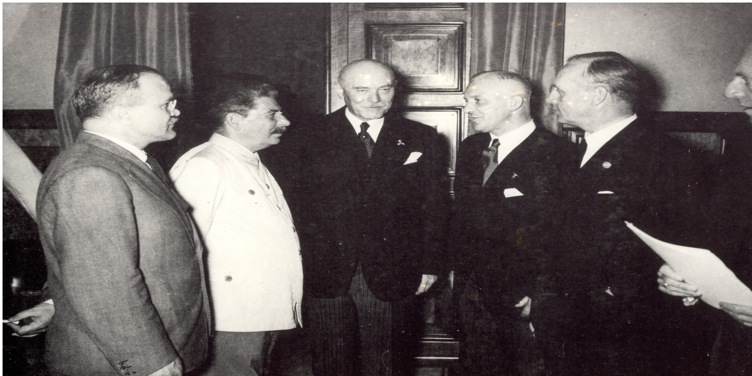
Członkowie niemieckiej delegacji i przedstawiciele najwyższych władz sowieckich podczas podpisania niemiecko-sowieckiego paktu o nieagresji, 23/24 sierpnia 1939 r.

https://przystanekhistoria.pl/pa2/tematy/zsrs/85696,Czy-pakt-Ribbentrop-Molotow-byl-paktem-dwoch-marksistowskich-ideologii.html