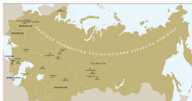
Mapa nr 2. Obojzy na terenie ZSRS, do których trafiali deportowani Górnoszlązacy

Oddział IPN w Katowicach stara się stworzyć ich imienną listę. W tym roku zostanie wydana księga pamięci internowanych, aresztowanych i deportowanych do ZSRS w 1945 r. mieszkańców Górnego Śląska. Będzie zawierała biogramy 46 100 osób (dane personalne, informacje o pobycie w ZSRS, datę powrotu, a w przypadku śmierci przed powrotem z deportacji – ustalone miejsce i datę zgonu). Zbiór ten jest chyba pierwszym w Polsce ujęciem w takiej formie wielkiej akcji deportacyjnej z czasu II wojny światowej. Co ważne, jest to opracowanie prawie kompletne, obejmuje bowiem ok. 98 proc. wszystkich represjonowanych.