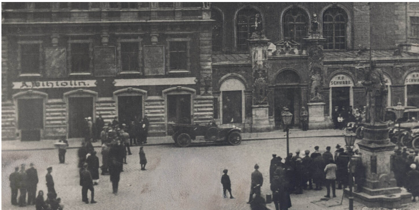
Pałac Czarobogorodków w Rydze, w którym odbyły się rokowania pokojowe polsko-sowieckie.

https://przystanekhistoria.pl/pa2/tematy/zsrs/77860,Niewykonanie-Traktatu-Ryskiego-przez-ZSRS.html