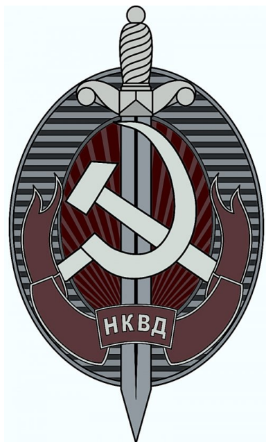
Embelmat NKWD (kliknij aby zobaczyć całość)

która zastąpiła dotychczasową nazwę „izolator” (izolatory specjalnego przeznaczenia, które funkcjonowały od roku 1930 do 1937, zostały przemianowane na więzienia specjalnego przeznaczenia).