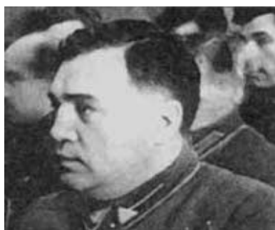
Michaił Frinowski (1900-1940)

16 lipca 1937 r. pojawił się podpisany przez zastępcę Jeżowa, Michaiła Frinowskiego, cyrkularz nr 51 o konfiskowaniu książeczek pracowniczych osobom, które przed uwięzieniem pobierały świadczenie emerytalne. Chodziło o to, że więźniowie emeryci lub ci, którzy pobierali emerytury za wysługę lat, przekazywali upoważnienia lub oddawali swoje książeczki rodzinom. Zatem bliscy takich więźniów przez jakiś czas mogli dostawać indywidualne czy akademickie emerytury. Od lipca 1937 r. naczelnicy organów NKWD osobiście odpowiadali za konfiskatę książeczek podczas aresztowania.