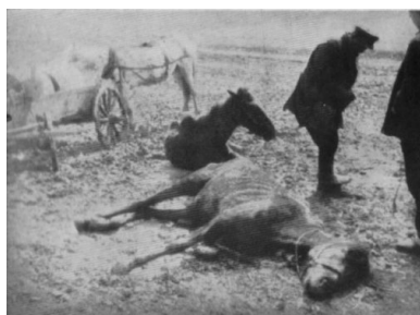
Wielki Głód na Ukrainie (okolice Charkowa, 1933 r.)