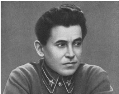
Nikołaj Jeżow (1895-1940)

Jeżow ostro skrytykował „biurokratyczne” podejście w działaniach kierownictw przedsiębiorstw i instytucji państwowych, co, według niego, utrudniało wykrywanie „szkodników” i „szpiegów”. Stało się jasne, że fala krwawych czystek i dekonspiracji nie ominie nikogo.