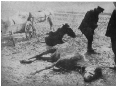
Wielki Głód na Ukrainie (okolice Charkowa, 1933 r.)