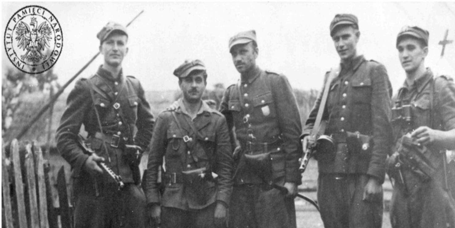
Żołnierze 5. Brygady Wileńskiej AK. Białostoczczyzna, 1945 r.

https://przystanekhistoria.pl/pa2/tematy/zolnierze-wykleci/98631,Egzekucja-majora-Smierc-Zygmunta-Szendzielarza-Lupaszki.html