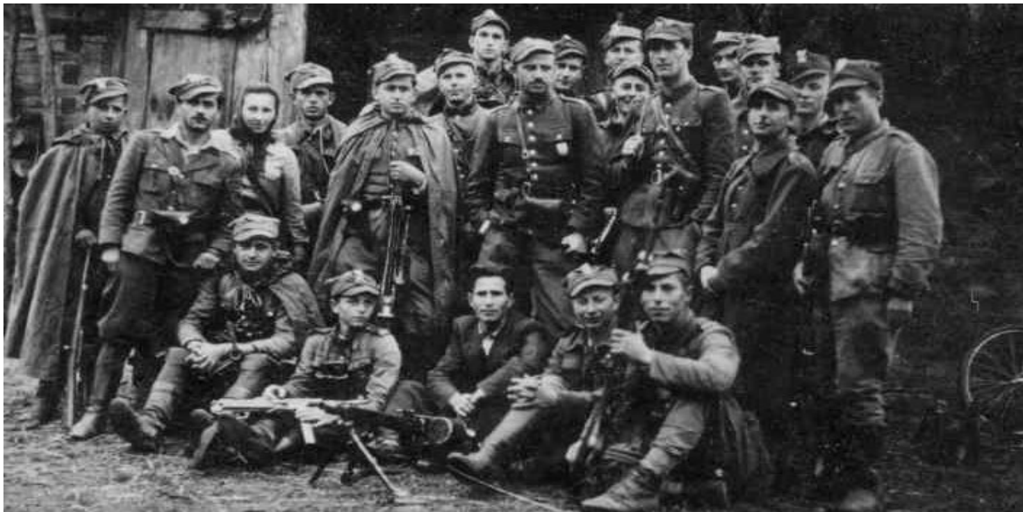
Ostatnia koncentracja 5 Brygady Wileńskiej AK, wrzesień 1945, Białostoczczyzna

https://przystanekhistoria.pl/pa2/tematy/zolnierze-wykleci/92942,Ni-sladu-ni-znaku-zycie-i-smierc-Zelaznego.html