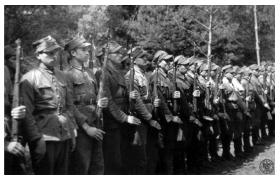
Kurs podoficerski Obwodu Tomaszów Lubelski AK-DSZ, wiosna 1945 r.