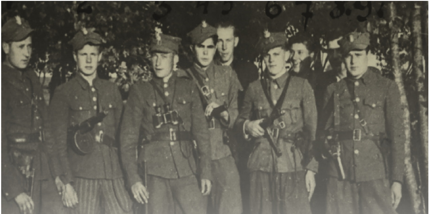
Zołnierze 5. Wileńskiej Brygady AK, sierpień 1946 r. Fot. AIPN

https://przystanekhistoria.pl/pa2/tematy/zolnierze-wykleci/89911,Niezlomni.html