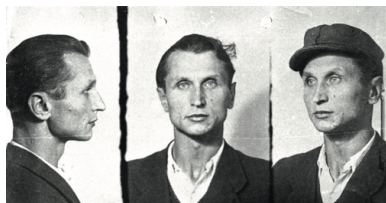
„Warszyc” - zdjęcia sygnalityczne

„Warszyca” w chwili największego rozwoju liczyło ponad 4 tys. ludzi – likwidowało placówki UB, uwalniało więźniów (jak w kwietniu 1946 r. w Radomsku), rozbijało obławy. Mocno osadzony w terenie mógł liczyć na pomoc miejscowej ludności – docierał do niej również za pośrednictwem ulotek i gazetek. W ręce bezpieki dostał się z powodu zdrady w połowie 1946 r. – stracono go 19 lutego 1947 r. w Łodzi.