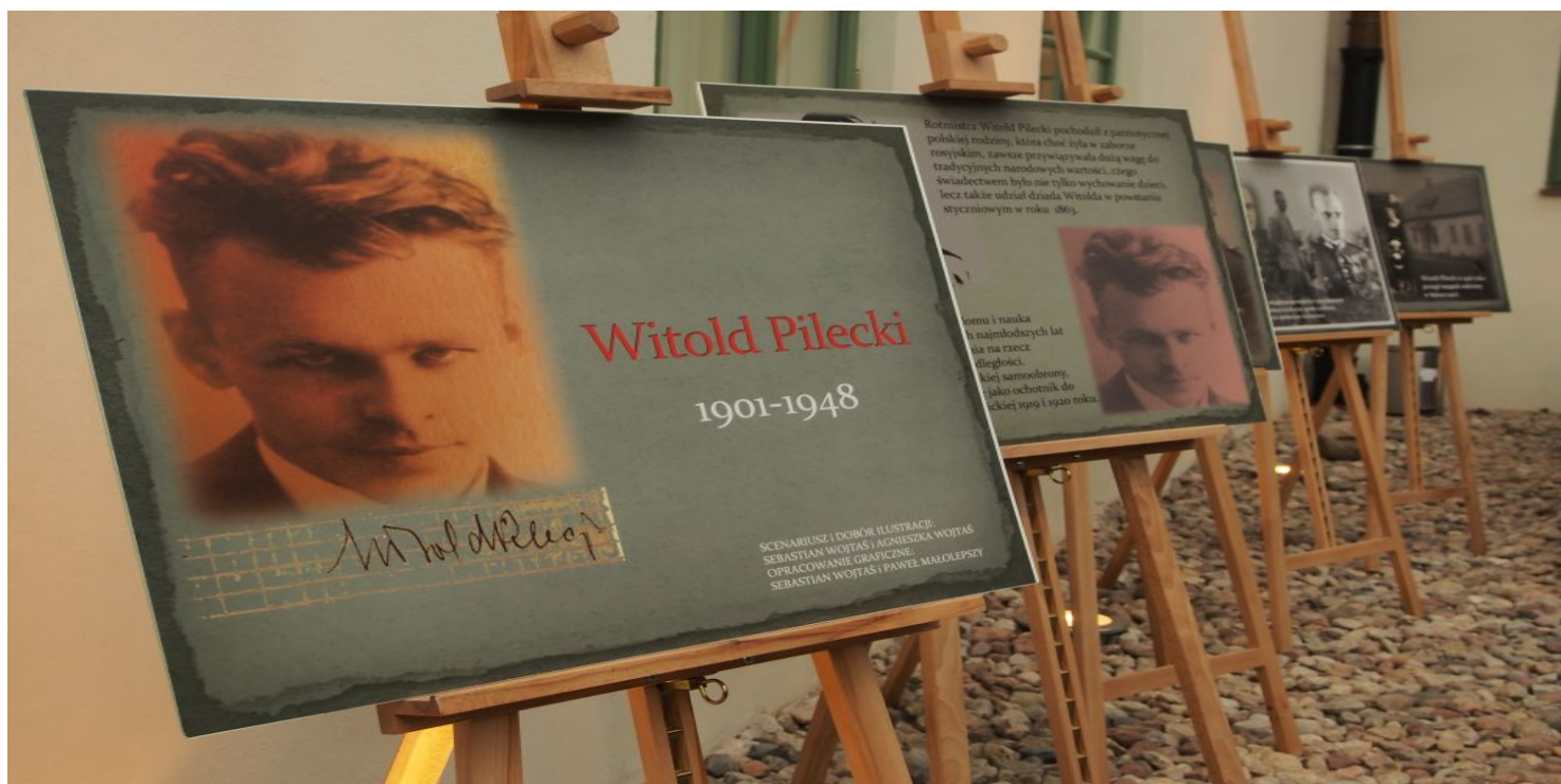
Ekspozycja poświęcona Rotmistrzowi (IPN Łódź)

https://przystanekhistoria.pl/pa2/tematy/zolnierze-wykleci/79768,Wyrok-na-Witolda-Pileckiego.html