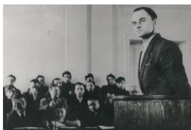
Witold Pilecki przed Wojskowym Sądem Rejonowym w Warszawie.