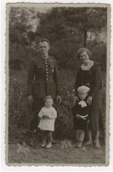
Witold Pilecki z żoną i dziećmi, Ostrów Mazowiecka, 1934 r.