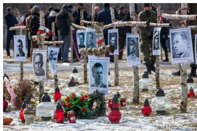
Narodowy Dzień Pamięci „Żołnierzy Wyklętych” na powązkowskiej „Łączce”, 2018.

negować, poddając w wątpliwość także istotę samego zbrojnego oporu. Z drugiej strony mamy z kolei tendencję do promowania jako godnych czci i takich partyzantów, którzy mając w swym życiorysie etapy walki o niepodległość, odeszli od ideałów podziemnych dopuszczając się czynów, za które w latach wojny stanęliby przed sądami specjalnymi Polskiego Państwa Podziemnego.