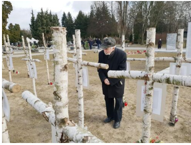
„Łączka”, 1 marca 2019. Fot.