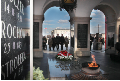
Grób Nieznanego Żołnierza, uroczystości 1 marca na placu marsz. Józefa Piłsudskiego w Warszawie, 2020.

Podziemie przeprowadzało także akcje dyscyplinujące – w tym wykonywało wyroki śmierci wydane przez dowódców oddziałów na szczególnie aktywnych działaczach narzuconego Polsce przez Moskwę reżimu czy osoby, które zagrażały partyzantom – np. donosząc bezpiece.