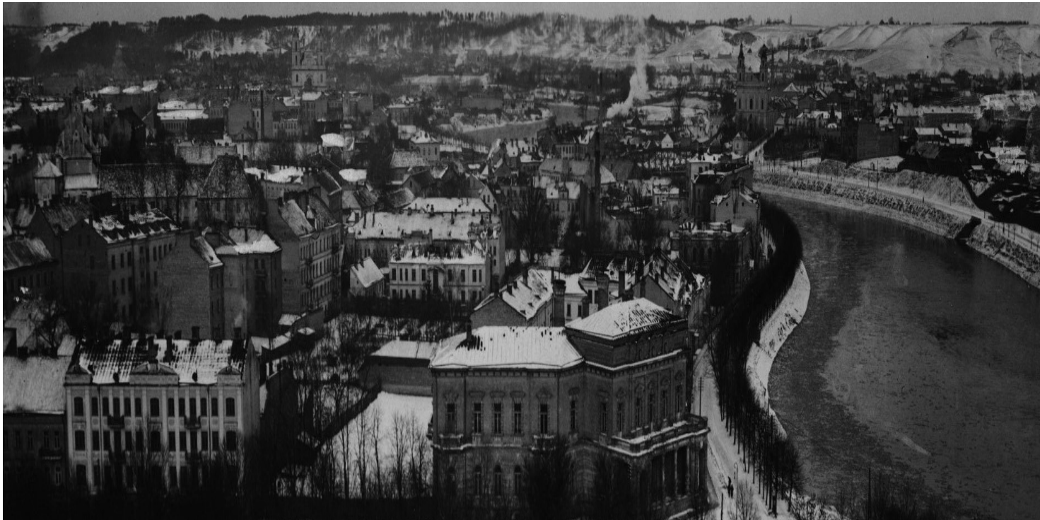
Panorama Wilna.

https://przystanekhistoria.pl/pa2/tematy/zolnierze-wykleci/69456,Obowiazek-wobec-Polski.html