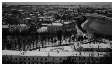
Panorama Wilna. Widok z Góry Zamkowej w kierunku Starego Miasta i Śnipiszek. Na pierwszym planie koszary 3. Pułku Saperów, centralnie Biblioteka im. Wróblewskich (dawny pałac Tyszkiewiczów). Z prawej widoczna rzeka Wilia. Druga Rzeczpospolita.