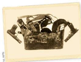
↳ Torba z uzbrojeniem znaleziona przy zabitym „Lalusiu”

Poszukiwania „Lalusia” prowadzone przez UB i SB były oznaczone kryptonimem „Pożar”. Działaniami operacyjnymi objęto jego najbliższą rodzinę i znajomych. Podejmowano próby pozyskiwania konfidentów, którzy mieli obserwować i dostarczać informacji dotyczących jego najbliższych krewnych i pomocników. W domach kilku z nich zainstalowano aparaturę podsłuchową.