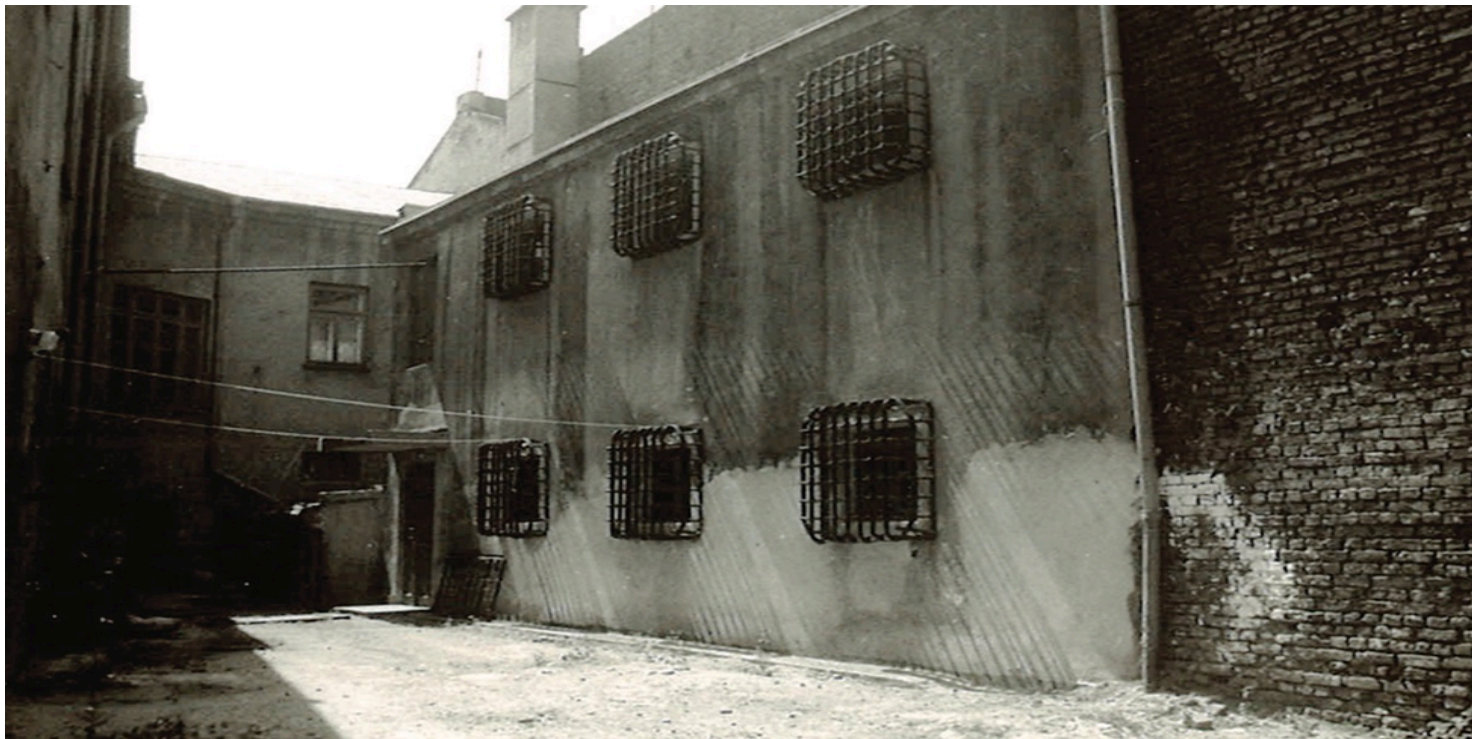
Areszt miejski w Radomsku, z którego dwukrotnie uwalniano więźniów

https://przystanekhistoria.pl/pa2/tematy/zolnierze-wykleci/101193,Dowodca-akcji-na-Radomsko-Porucznik-Jan-Rogulka-Grot-19131946.html