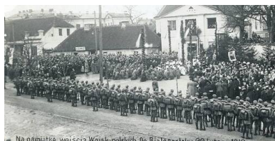
Zdjęcie upamiętniające wejście wojsk polskich do Białegostoku, 22 lutego 1919 r.

Białystok na wyzwolenie spod okupacji niemieckiej armii Ober-Ostu czekał do lutego 1919 r. Było to konsekwencją położenia miasta. W związku z przeprowadzaną ewakuacją wojsk niemieckich z frontu wschodniego do Prus Niemcy nie mogli pozwolić sobie na oddanie w ręce polskie kluczowych punktów istotnych w realizacji tego przedsięwzięcia. Sytuacja uległa zmianie po podpisaniu 5 lutego 1919 r. tzw. umowy białostockiej. Rozstrzygała ona kwestię odwrotu wojsk niemieckich, gwarantowała przemarsz wojsk polskich przez okupowane tereny, w kierunku których zdążali już bolszewicy oraz zakładała przejmowanie na nich władzy przez polską administrację.