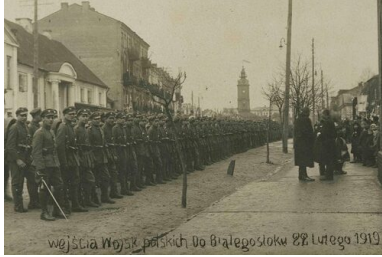
Zdjęcie upamiętniające wejście wojsk polskich do Białegostoku, 22 lutego 1919 r.

udziałem polskich żołnierzy i mieszkańców miasta. Choć Białystok z okręgiem białostockim przeszedł pod władzę wojsk polskich i powołano w nim tymczasową polską administrację cywilną, to automatycznie nie został on wcielony w granicę odrodzonej Rzeczypospolitej Polskiej (ureczywistniło się to dopiero w kolejnych miesiącach).