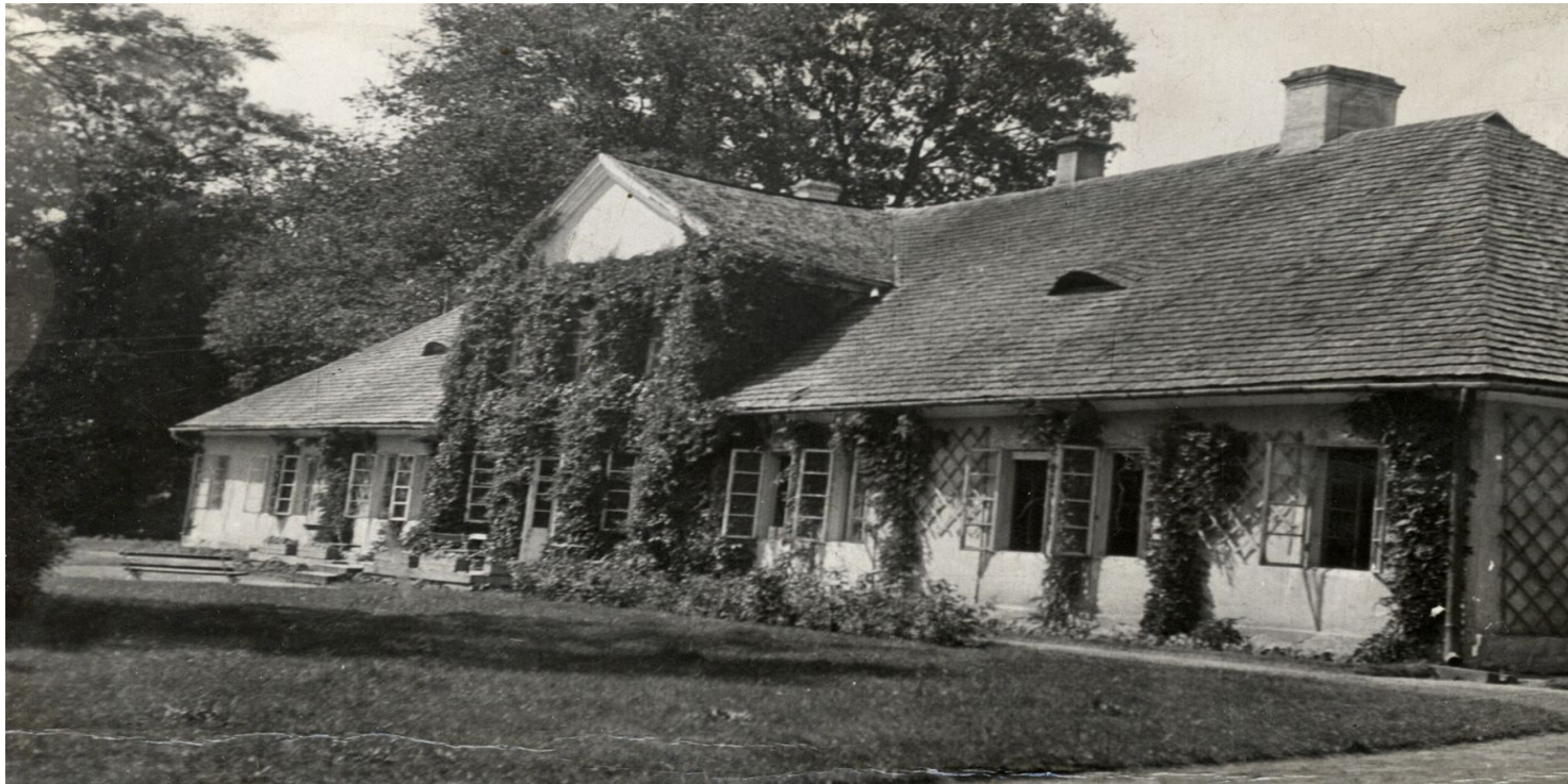
Dwór w Chorzelowie

https://przystanekhistoria.pl/pa2/tematy/ziemianstwo/106126,Karol-Tarnowski-Ziemianin-w-burzliwych-czasach.html