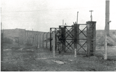
Główna brama obozu w Jaworznie, stan obiektów w 1959 r.