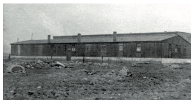
Barak obozu w Jaworznie

Wśród więźniów obozu w Świętochłowicach znajdowali się volksdeutsche, Niemcy i Polacy (także z tzw. centralnej Polski, członkowie Armii Krajowej i Narodowych Sił Zbrojnych), jak również Żydzi oraz obcokrajowcy (m.in. Austriacy, Rumuni, Czesi i Belg). Byli tu także więźni mieszkańcy Górnego Śląska oskarżeni o podpisanie volkslisty i niechęć do władzy komunistycznej oraz jeńcy wojenni. Do obozu kierowano osoby zatrzymywane przez MO, Służbę Bezpieczeństwa oraz NKWD. Ówczesne władze przekonywały mieszkańców Górnego Śląska, że znajdują się tam wyłącznie Niemcy oraz kolaboranci.