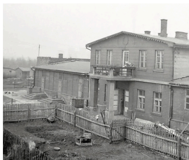
Barak dla strażników obozu w Jaworznie (fot. Muzeum Miejskie w Jaworznie)

W czasie II wojny światowej dla okupanta niemieckiego ważnym źródłem dochodu były złoża węgla kamiennego znajdujące się na Górnym Śląsku i w Zagłębiu Śląsko-Dąbrowskim. Niemcy, chcąc wydobywać węgiel jak najtańszym kosztem, utworzyli na terenie kopalń lub w ich pobliżu obozy pracy oraz jenieckie oddziały robocze.