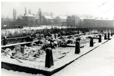
Zbiorowa mogiła ofiar sowieckiej pacyfikacji w Miechowicach 25-27 stycznia 1945 r.

Szczególnie bestialskie były gwałty zbiorowe – kilku, kilkunastu, a nawet więcej żołnierzy znęcało się nad jedną ofiarą. Ta najczęściej umierała w ich rękach lub później – na skutek odniesionych ran i obrażeń. Sprzeciw wzmagał brutalne zachowanie Sowietów, a nad kobietami stawiającymi opór oprawcom pastwiono się z jeszcze większym okrucieństwem lub je zabijano. Mordowano również tych, którzy usiłowali zapobiec gwałtom. Wśród zastrzelonych bądź pobitych na śmierć tylko za to, że stanęli w obronie kobiet, byli rodzice, dziadkowie, osoby starsze i księża.