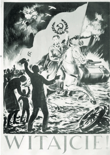
Plakat propagandowy rozwieszany na początku 1945 r. po zajęciu Górnego Śląska przez Armię Czerwoną.

Relacje świadków przynoszą z jednej strony obraz chaotycznego terroru, z drugiej zaś metodycznych represji. Nie oszczędzono nawet robotniczych przedmieść. W Gliwicach-Sośnicy zgładzono pensjonariuszy domu starców, a budynek z jego mieszkańcami podpalono. W podgliwickim Szywałdzie (dziś: Bojków – dzielnica miasta) zadano śmierć 120 ludziom, w tym wielu kobietom i kilkorgu dzieciom 2 .