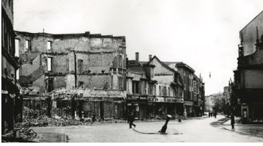
Śródmieście Opola wiosną 1945 r.

Ile kobiet potajemnie spędziło płod, bez jakiegokolwiek rejestracji i zgłoszenia się do lekarza, nie wiadomo.