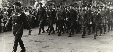
Pożegnanie oddziałów Armii Czerwonej opuszczających Górny Śląsk, Katowice, jesień 1945 r.