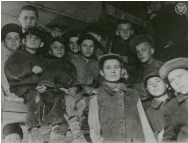
W drodze do życia. Dzieci polskie - po straszliwych doświadczeniach zgotowanych im przez Związek Sowiecki po agresji na Polskę 17 września 1939 r. - ewakuowane z „niehumanitarnej ziemi” do Persji.

Niestety, już w połowie 1942 r. władze sowieckie zaczęły likwidować polski aparat opieki „klasycznymi” dla siebie, tj. policyjnymi, metodami. Był to „milowy” krok w kierunku odbierania obywatelom polskim w ZSRS tego, co dał im układ Sikorski-Majski i ogłoszona w jego następstwie „amnestia”. W kwietniu następnego roku ZSRS dokończył dzieła i zlikwidował stosunki z rządem RP (formalnie je zawieszając). Tym samym koncepcja modus vivendi Polski z zaborczym państwem Stalina, ucieleśniona przez układ lipcowy, legła w gruzach.