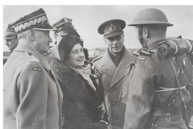
Premier Rządu RP na Wychodźstwie i Naczelny Wódz Polskich Sił Zbrojnych gen. Władysław Sikorski w towarzystwie króla Anglii Jerzego VI i królowej Elżbiety.