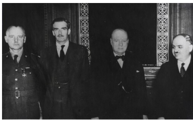
Od lewej: gen. Władysław Sikorski, Anthony Eden, Winston Churchill oraz Iwan Majska z okazji podpisania traktatu polsko-sowieckiego w Londynie 30 lipca 1941 r.

Czy można było uniknąć nieadekwatnego i uwłaczającego obywatelom RP pojęcia „amnestia”, a jednocześnie przywrócić im wolność? Raczej nie, ponieważ Polacy nie mogli, Brytyjczycy zaś nie chcieli, wymóc na Stalinie innego rozwiązania. Mimo swej ułomności przyniosło ono obywatelom RP, udręczonym pobylem na „niehumanitarnej ziemi”, upragnioną wolność. Wielu z nich znajdowało się na skraju wytrzymałości. Kolejna zima niewątpliwie zdziesiątkowałaby populację wywiezionych z Polski.