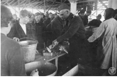
Jeden z polskich obozów wojskowych Armii Polskiej w ZSRS, 1942 r.