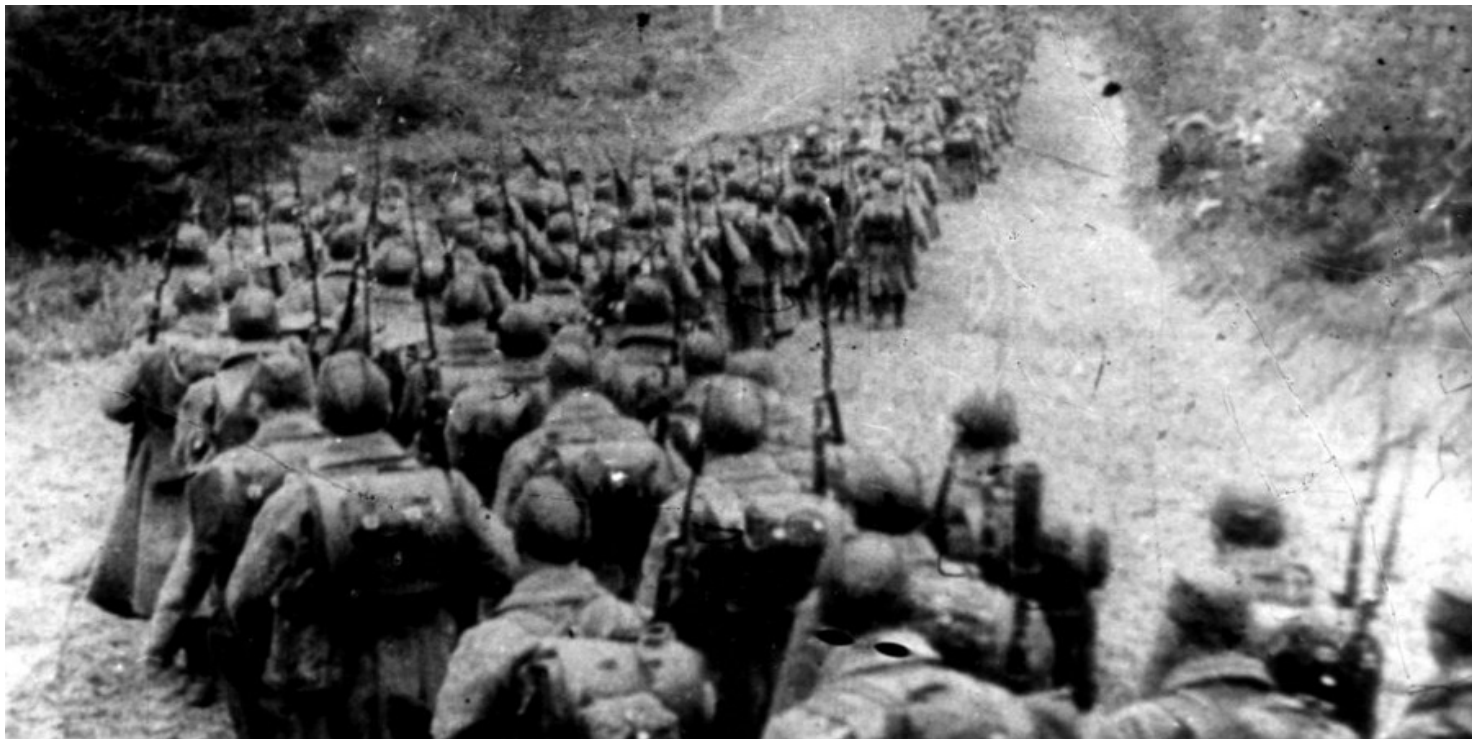
Kolumny piechoty sowieckiej wkraczające do Polski, 17 września 1939 r.

https://przystanekhistoria.pl/pa2/tematy/zbrodnie-sowieckie/86206,Sowieckie-zbrodnie-i-represje-wobec-obywateli-polskich-po-17-wrzesnia-1939-roku.html