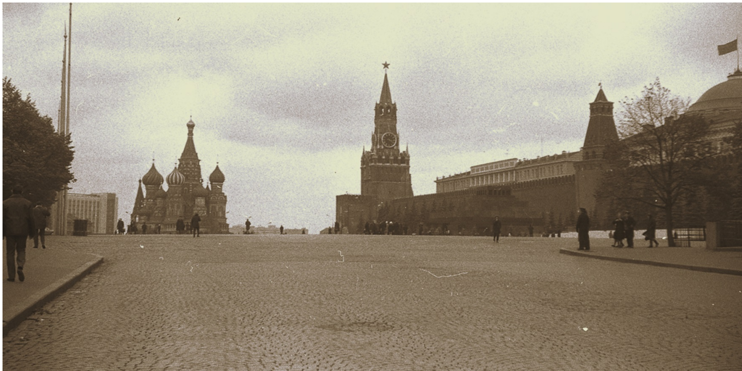
Moskwa, Plac Czerwony.

https://przystanekhistoria.pl/pa2/tematy/zbrodnie-sowieckie/75026,Lawrientij-Pawlowicz-Beria-morderca-za-biurka.html