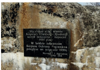
Tablica pamiątkowa poświęcona żołnierzom KOP na ścianie schronu w Tynnem.

Zanim doszło do agresji sowieckiej, żołnierze batalionu KOP „Sarny” czekali na przerzucenie transportem kolejowym na front zachodni. Po zbombardowaniu przez Niemców 16 września stacji w Równem, a wkrótce przez Sowietów węzła w Sarnach ruch kolejowy na linii Sarny-Równe ustał.