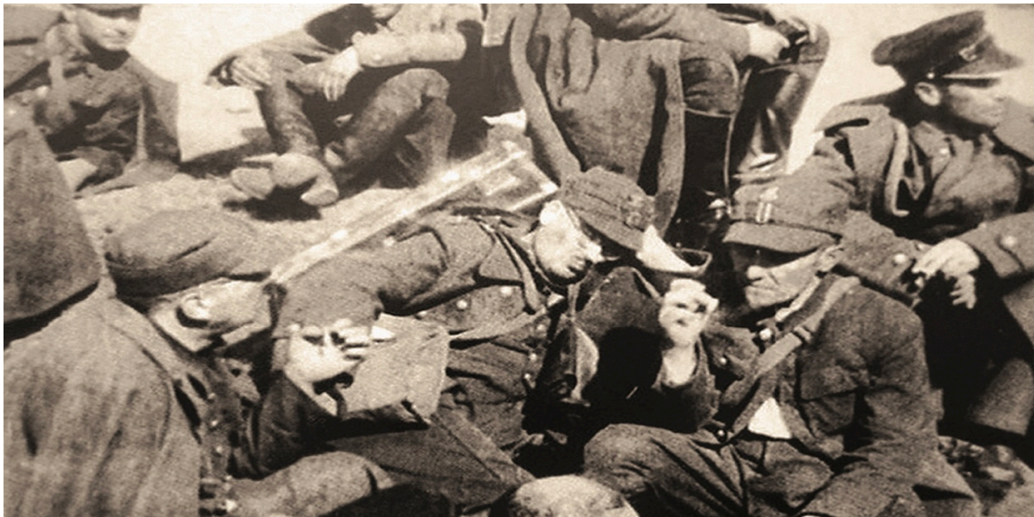
Polscy jeńcy, wrzesień 1939 r. Kadr z sowieckiej kroniki filmowej

https://przystanekhistoria.pl/pa2/tematy/zbrodnie-sowieckie/106707,Sowieckie-obozy-specjalne-dla-obywateli-polskich-w-latach-1939-1940.html