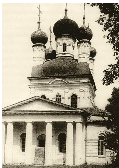
Cerkiew na terenie obozu

Do Ostaszkowa trafiło ponad 6,5 tys. osób stanowiących tzw. „kontyngent specjalny”, z których to ostatecznie do 1 grudnia 1939 r. pozostało 6 tys. (5033 policjantów – szeregowych i podoficerów, 150 strażników więziennych, 40 żandarmów, 41 żołnierzy KOP, 263 oficerów wszystkich kategorii, 127 żołnierzy i podoficerów WP, 169 osób z rezerwy policji, 35 osadników wojskowych i junaków oraz 105 cywilów; wśród wymienionych byli także funkcjonariusze wywiadu i kontrwywiadu). W kolejnych miesiącach liczba uwięzionych zwiększyła się do 6364 osób. Dodatkowi jeńcy zostali przetransportowani do Ostaszkowa z innych obozów i więzień. Natomiast w okresie weryfikowania jeńców, które skutkowało odesłaniem do obozu w Kozielsku oficerów WP, zabroniono zwalniać do domów szeregowych policjantów, rezerwistów i lekarzy 13 . Komendantem obozu ostaszkowskiego był mjr bezpieczeństwa państwowego Paweł Borisowiec. Straż pełnił 135. batalion konwojowy NKWD, dla którego „bazy wsparcia” stanowiła okoliczna ludność.