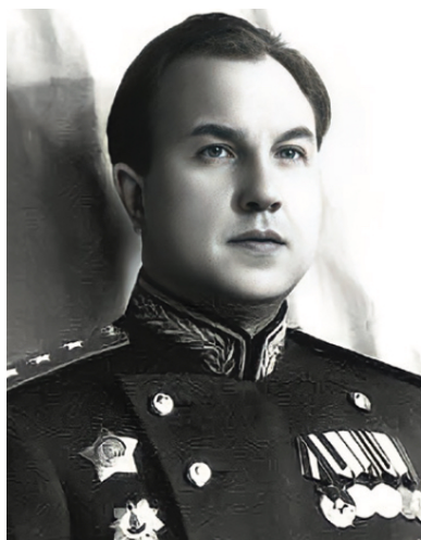
Generał Wiktor Abakumow

Okres PRL nie sprzyjał upominaniu się o ujawnienie tej zbrodni. Dopiero odnalezienie w latach osiemdziesiątych zbiorowych mogił w Gibach dało nowy impuls do poszukiwań i obudzenia uśpionej pamięci (okazało się później, że to mylny trop, były to bowiem groby żołnierzy niemieckich). Powstał wówczas Obywatelski Komitet Poszukiwań Mieszkańców Suwalszczyzny Zaginionych w Lipcu 1945 roku, który zaczął zbierać wśród rodzin ofiar – mimo przeciwdziałania władz komunistycznych – ankiety dotyczące ich zaginionych bliskich. Po 1989 r. śledztwo podjęły polskie organy państwowe.