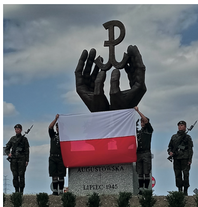
Odsłonięcie pomnika Ofiar Obławy Augustowskiej, Suwałki, 2018 r.

Aresztowano ok. 7 tys. ludzi. Więźniów bito, starając się wymusić zeznania o przynależności do Armii Krajowej. Niektórych wypuszczano.