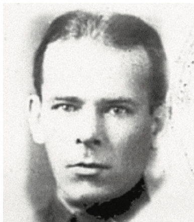
Generał Paweł Zielenin