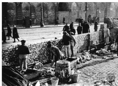
Budowa murów getta w Warszawie, 1940. Wylot ul. Grzybowskiej na ul. Graniczną -

Kwestia odpowiedzialności karnej za pomoc Żydom na terenach wcielonych do Rzeszy wymaga jednak nadal szczegółowych badań. Podobnie jak i na opisywanych wcześniej terenach wschodnich.