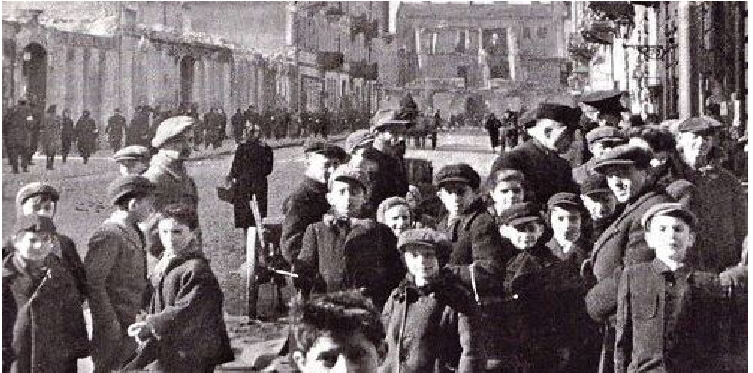
Dzieci w getcie warszawskim

https://przystanekhistoria.pl/pa2/tematy/zbrodnie-niemieckie/97095,Pomoc-Zydom-karana-smiercia-Zarys-niemieckich-przepisow-okupacyjnych-na-obszarze.html