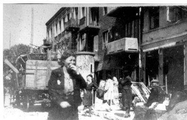
Wysiedlanie kutnowskich Żydów do getta, 16 czerwca 1940 r.

Kara śmierci za udzielanie pomocy Żydom, zgodnie z trzecim rozporządzeniem z 15 października 1941 r. o ograniczeniu pobytu w Generalnym Gubernatorstwie, obowiązywała na terenie pięciu dystryktów Generalnego Gubernatorstwa. Tutaj też, najprawdopodobniej, była ona najczęściej wykonywana. Taką samą karę zarządził na terenie Reichskommissariat Ukraine i Reichskommissariat Ost (Wołyń, Polesie, Nowogródzczyzna, wschodnia Białostoczyzna, Wileńszczyzna), choć tam najprawdopodobniej nie wydano aktu prawnego, porównywalnego z tym w GG. Na chwilę obecną nie są znane dokładne daty takich rozporządzeń.