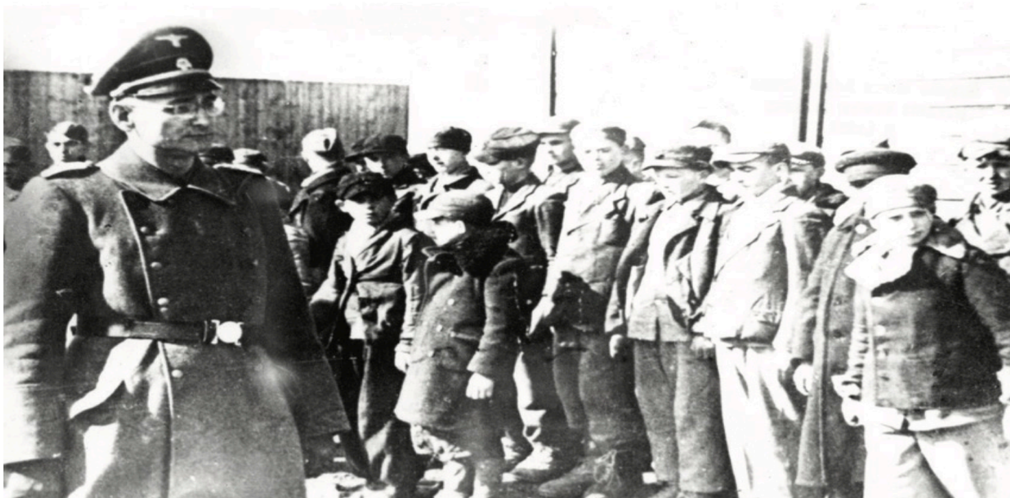
Dzieci wizytowane podczas pracy

https://przystanekhistoria.pl/pa2/tematy/zbrodnie-niemieckie/96123,Oboz-przy-Przemyslowej-w-Lodzi-pieklo-dla-najmlodszych.html