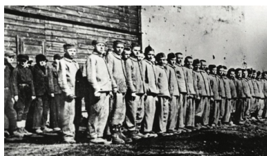
Apel w obozie dla chłopców

Dzieci zmuszane były do ciężkiej, wyniszczającej pracy, z reguły przekraczającej ich możliwości. Mali więźniowie po dwanaście godzin dziennie reperowali buty, plecaki lub odzież dla niemieckich żołnierzy. Prostowali igły tkackie lub produkowali buty ze słomy do chodzenia po śniegu. Najcięższą pracą było „wałowanie” – polegało ono na ciągnięciu przez kilku chłopców rodzaju walca i równaniu w ten sposób terenu. Odbywało się to czasem przy dużym mrozie i biciu przez strażników. Nadzorcy ustalali dzienne limity prac i w przypadku ich niewykonania dzieci spotykały dodatkowe szykany. Część strażników o sadystycznych skłonnościach pastwiła się nad dziećmi nienadążającymi za „normami” bądź tymi, które z jakichś powodów naraziły się tzw. wychowawcom. W kilku wypadkach znęcanie się doprowadziło do śmierci dzieci.