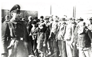
Dzieci wizytowane podczas pracy

Tragiczne losy tych dzieci wywołują ostatnio coraz większe zainteresowanie nie tylko historyków i dziennikarzy, ale także osób, które uważają, że cierpienie najmłodszych jest tym, co należy upamiętnić w sposób szczególny. Przybrało to formy zarówno działań spontanicznych, jak i administracyjnych – na najwyższym szczeblu, których zwieńczeniem jest decyzja o powołaniu muzeum dokumentującego historię obozu.