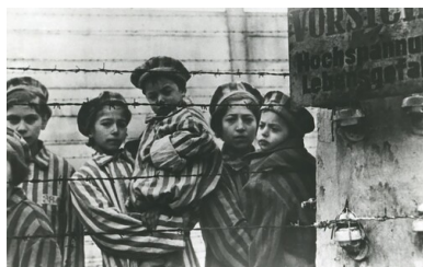
Dzieci - więźniowie obozu oświęcimskiego po wyzwoleniu, luty 1945 r.

Kolejny problem stanowili umysłowo chorzy, a wśród nich niebezpieczni dla otoczenia furiaci, których należało pilnować, aby nie doszło np. do zaproszenia przez nich ognia i pożaru.