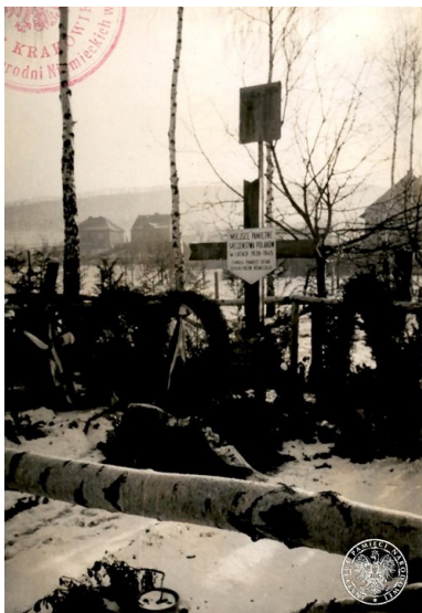
Wola Justowska, krzyż i tablica pamiątkowa w miejscu mordu dokonanego przez Niemców 28 lipca 1943 r.

Po dokonaniu zbrodni jeden z niemieckich oficerów wygłosił mowę do osób zgromadzonych na placu, w których wezwał ich do lojalności wobec władz niemieckich oraz do regularnego składania kontyngentów. Mieszkańców skłonnych do wypełnienia powyższych zaleceń wezwał do podniesienia do góry ręki. Pod wpływem strachu i ostatnich przeżyć, wszyscy zgromadzeni uczynili to. Ów moment został sfilmowany przez Niemców. (27 lutego 1945 r. zwłoki ofiar zostały ekshumowane. Następnego dnia odbył się ich uroczysty pogrzeb na Cmentarzu Salwatorskim.)