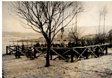
Wola Justowska, ogólny widok miejsca mordu dokonanego przez Niemców 28 lipca 1943 r. (zdjęcie wykonane po ekshumacji zwłok).