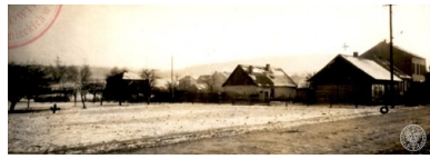
Wola Justowska, ogólny widok miejsca mordu dokonanego przez Niemców na Polakach 28 lipca 1943 r.