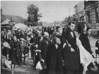
Deportacja Żydów rzeszowskich do obozu w Bełżcu, 1942 r. (domena publiczna)

wyłapywali ukrywające się osoby, a następnie eskortowali je na miejsce zbiórki. Zdarzało się, że część osób rozstrzelano na miejscu. Na placu zbiorczym dokonywano rewizji, a także selekcji. Niewielką grupę, ok. 200 osób, pozostawiono do porządkowania terenu getta.