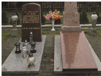
Pomnik wzniesiony na zbiorowym grobie ofiar pacyfikacji Sikor-Tomkowień.

Oddział („grupa Müllera” i oficerowie gestapo) liczący dwustu, trzystu funkcjonariuszy przybył kolumną samochodową do Rutek. Około północy z 12 na 13 lipca, po dołączeniu doń miejscowych żandarmów, został on podzielony na trzy grupy, które wyruszyły w stronę Zawad, Sikor-Tomkowień i Laskowca Starego.