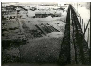
Obóz w Żabikowie.