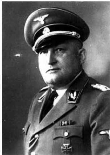
Richard Glücks, następca Theodora Eickego.

do Rzeszy Austrii, aneksji Sudetów i rozbiorze Czechosłowacji również Austriaków i Czechów. Dziś trudno oszacować, jaki odsetek z nich został zamordowany.