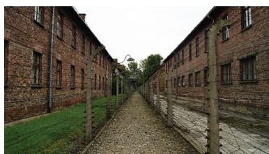
Ogrodzenie z drutu kolczastego w KL Auschwitz.

Podlegające RSHA placówki gestapo, funkcjonujące w obozach koncentracyjnych pod nazwą Politische Abteilung (oddział polityczny), decydowały m.in. o egzekucjach bądź innych sankcjach wobec więźniów. Niezależnie od tego stojący na czele administracji lagrów komendanci, kompetencyjnie podlegający Urzędowi D SS-WVHA (który przekazywał im instrukcje dotyczące zarządzania obozami), mieli wolną rękę w kwestii stosowania kar, włącznie z karą śmierci.