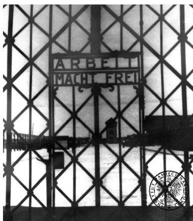
Brama obozu koncentracyjnego Dachau, zdjęcie z okresu funkcjonowania lagru.

Na terenie Rzeszy (w granicach z 31 grudnia 1937 r.) oraz w siedemnastu okupowanych państwach Europy Niemcy zorganizowali łącznie ok. 12 tys. obozów, podobozów, komand pracy, gett i więzień. Blisko połowę takich ośrodków zlokalizowano na ziemiach polskich – więziono w nich ok. 7,5 mln, z czego zamordowano 6,7 mln, głównie Żydów i Polaków. Z niemal 4,5 mln obywateli RP, którzy przeszli przez hitlerowskie lagry, zginęło ok. 3,5 mln 9 . W samych obozach koncentracyjnych i ośrodkach natychmiastowej zagłady zginęło co najmniej 7,2 mln spośród ok. 9 mln więźniów (81 proc.). Dokładnej liczby więźniów i ofiar nie sposób ustalić, gdyż oprawcom udało się w znacznym stopniu zatrzeć ślady swoich zbrodni.