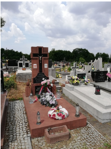
Grób bohaterskiej Rodziny

Warto dodać, że podczas rewizji w gospodarstwie Baranków funkcjonariusze nie odnaleźli wszystkich ukrywanych przez nich Żydów. Piąty mężczyzna znajdował się wówczas poza wsią – nie znamy jednak jego dalszych losów.