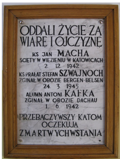
Tablica pamiątkowa w kościele św. Marii Magdaleny w Chorzowie Starym, 2018 r.