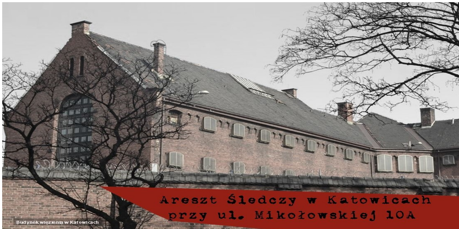
Areszt Śledczy w Katowicach

https://przystanekhistoria.pl/pa2/tematy/zbrodnie-niemieckie/87634,O-procesie-karnym-ksiedza-Jana-Machy-przed-sadem-niemieckim.html