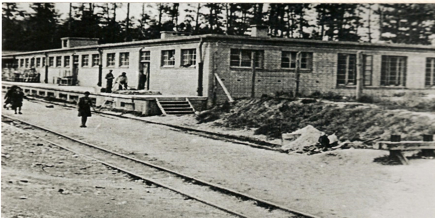
Niemiecki obóz pracy SS w Poniatowej. Hala nr 2, rampa kolejowa i magazyny. Ze zbiorów Prokuratury przy Sądzie Krajowym w Hamburgu

https://przystanekhistoria.pl/pa2/tematy/zbrodnie-niemieckie/87367,Erntefest-Dozynki-4-listopada-1943-r-egzekucja-zydowskich-wiezniow-obywateli-aus.html