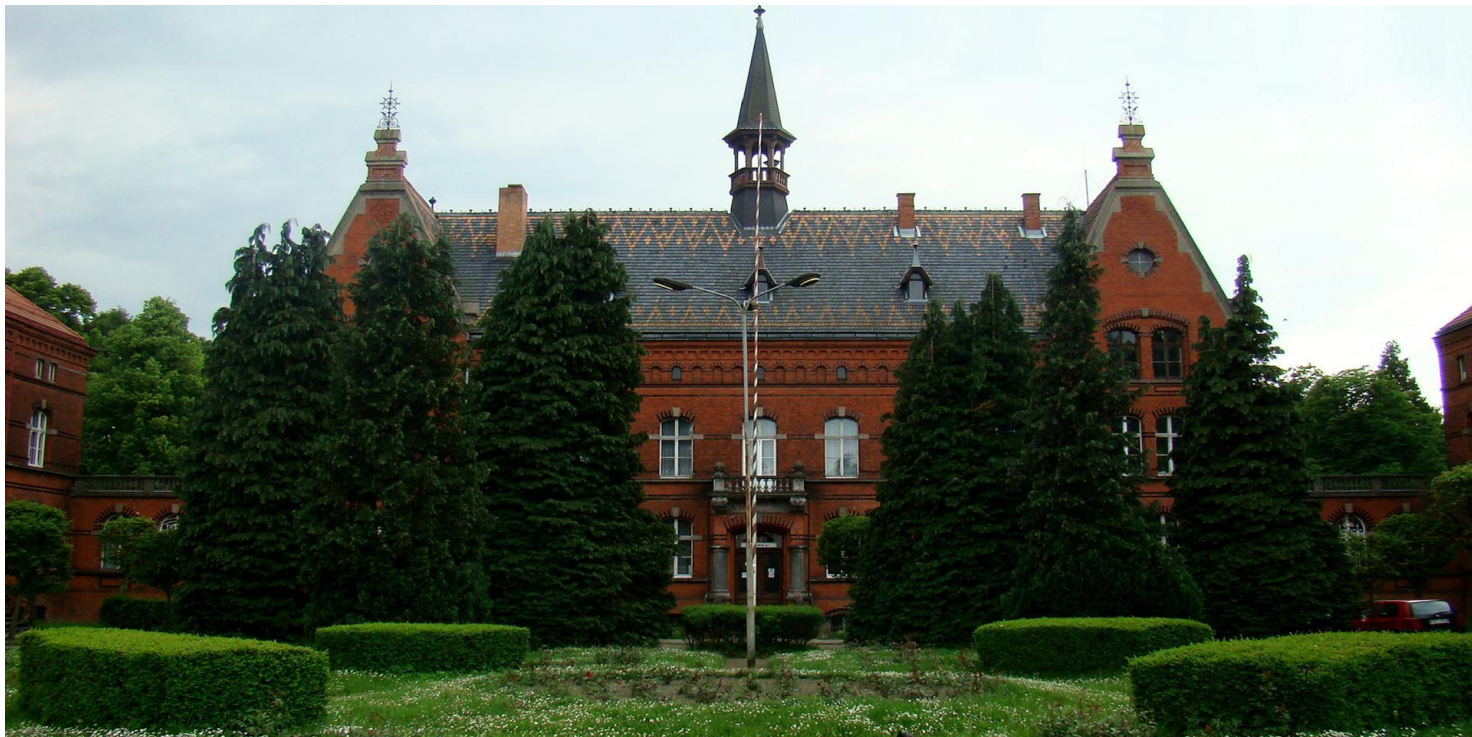
Szpital psychiatryczny w Kocborowie podczas II wojny światowej

https://przystanekhistoria.pl/pa2/tematy/zbrodnie-niemieckie/85223,Szpital-psychiatryczny-w-Kocborowie-podczas-II-wojny-swiatowej.html