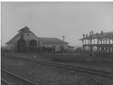
Stacja kolejowa w Pińczowie.

Należy pamiętać, że z Buska-Zdroju nie odchodziły bezpośrednio transporty do obozów koncentracyjnych. Osoby osadzone w więzieniach na terenie stolicy Kreishauptmannschaftu w tym celu przewożono do Pińczowa. Według księgi ewidencyjnej aresztu powiatowego w Busku-Zdroju prowadzonej w latach 1941-1944, 559 osób odesłano do więzienia w Pińczowie. Stamtąd więźniów najczęściej wywożono do KL Auschwitz-Birkenau.