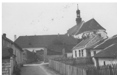
Pińczów, okres wolnej Polski (1918 - 1939). W tle widoczny kościół Nawiedzenia Najświętszej Maryi Panny (dawny kościół i klasztor Reformatów).