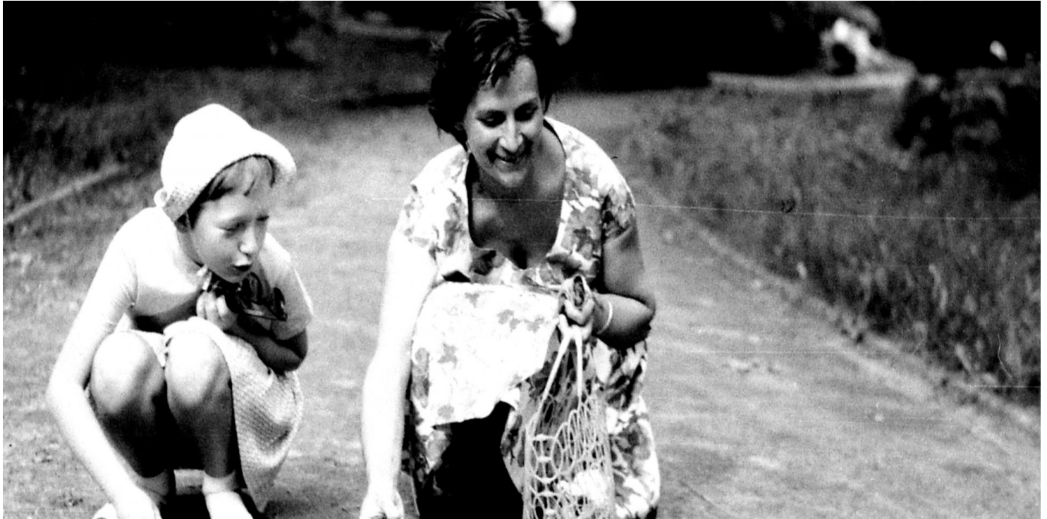
Zbiory Anny Wasilewskiej

https://przystanekhistoria.pl/pa2/tematy/zbrodnie-niemieckie/82871,Wokol-biografii-Wandy-Madejczyk-19252011.html