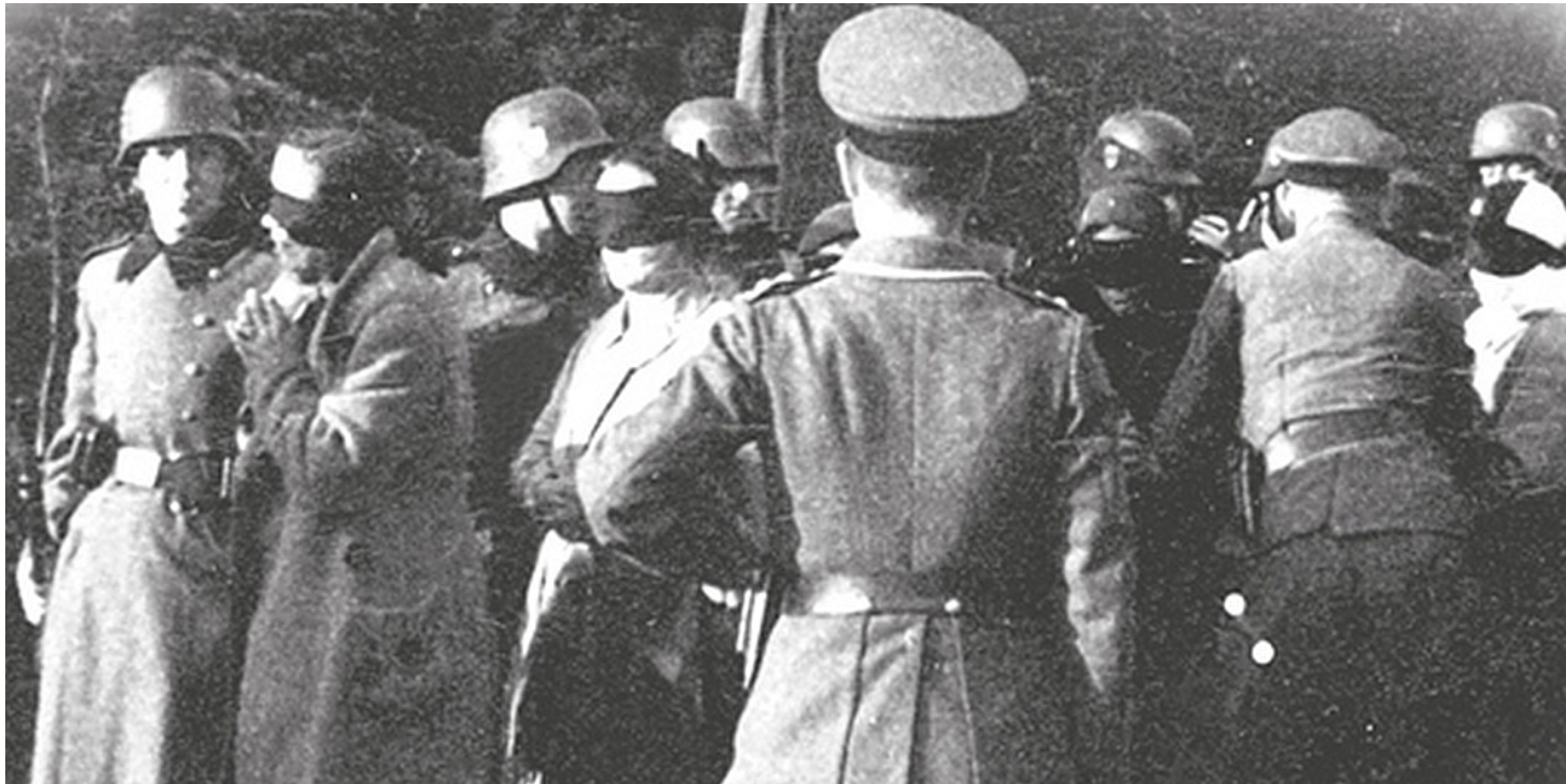
Egzekucja w Palmirach

https://przystanekhistoria.pl/pa2/tematy/zbrodnie-niemieckie/82828,Palmiry-symbol-niemieckiego-okrucienstwa.html