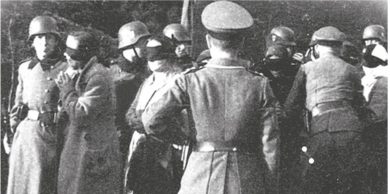
Egzekucja w Palmirach

https://przystanekhistoria.pl/pa2/tematy/zbrodnie-niemieckie/82828,Palmiry-symbol-niemieckiego-okrucienstwa.html