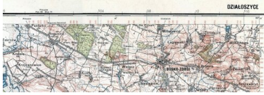
Fragmenc mapy Lasu Wędeckiego (PAS 47 SŁUP 31), skala 1-100 000, Warszawa 1938