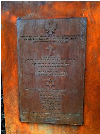
Tablica pamiątkowa na pomniku w Popardowej.