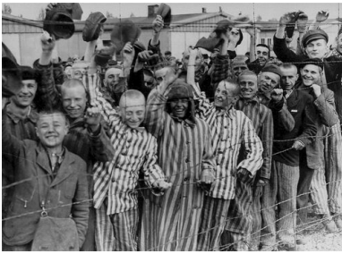
Wyzwoleni przez Amerykanów więźniowie KL Dachau

Na to pytanie odpowiedział sam Höß. Po pierwsze, często nie przestrzegano zasad i regulaminów, nie meldowano do Oranienburga o nadużyciach, bo nie leżało to w niczym interesie. Po drugie, przestrzeganie regulaminu było niemożliwe ze względu na brak odpowiedniego wyposażenia obozów (w instalacje i środki higieniczne, latryny, ubrania i bieliznę na zmianę, buty itd.) oraz zbyt dużą liczbę więźniów. Trzeci powód – Höß uznał go za najważniejszy – to samowola więźniów funkcyjnych (kapo), którzy najczęściej byli kryminalistami oraz strażników niższej rangi. Potrafili oni zawsze znaleźć pretekst, by znęcać się nad więźniami, a nawet prowokować pozorowane ucieczki, aby móc więźnia zabić.