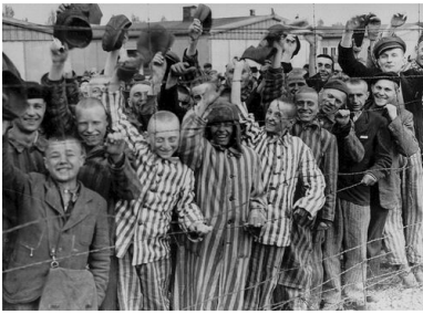
Wyzwoleni przez Amerykanów więźniowie KL Dachau

Na to pytanie odpowiedział sam Höß. Po pierwsze, często nie przestrzegano zasad i regulaminów, nie meldowano do Oranienburga o nadużyciach, bo nie leżało to w niczym interesie. Po drugie, przestrzeganie regulaminu było niemożliwe ze względu na brak odpowiedniego wyposażenia obozów (w instalacje i środki higieniczne, latryny, ubrania i bieliznę na zmianę, buty itd.) oraz zbyt dużą liczbę więźniów. Trzeci powód – Höß uznał go za najważniejszy – to samowola więźniów funkcyjnych (kapo), którzy najczęściej byli kryminalistami oraz strażników niższej rangi. Potrafili oni zawsze znaleźć pretekst, by znęcać się nad więźniami, a nawet prowokować pozorowane ucieczki, aby móc więźnia zabić.