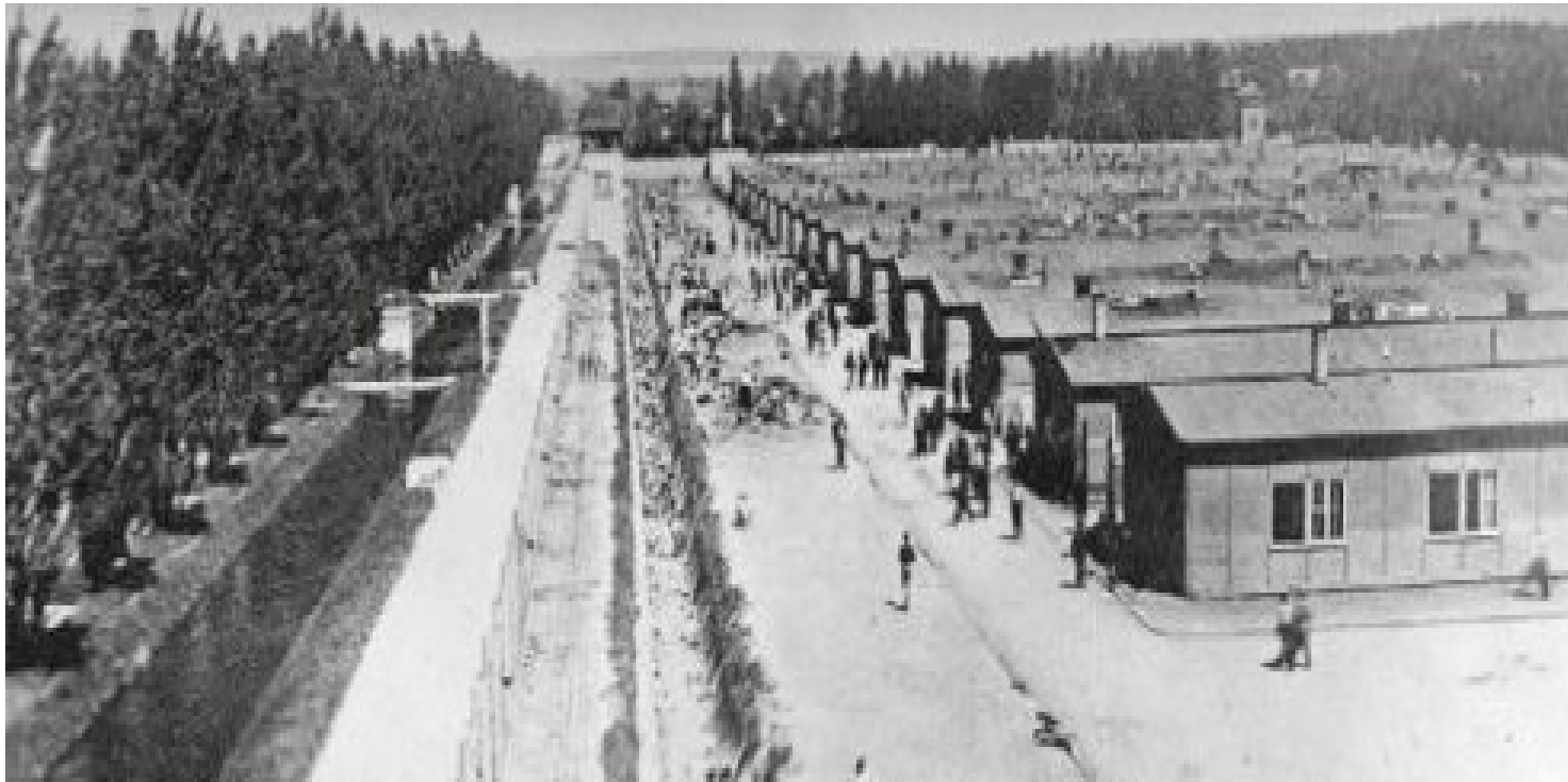
Widok na obóz Dachau po wyzwoleniu

https://przystanekhistoria.pl/pa2/tematy/zbrodnie-niemieckie/78070,Pierwszy-byl-KL-Dachau-Jak-wygladalo-centralne-zarzadzanie-niemieckimi-obozami-k.html