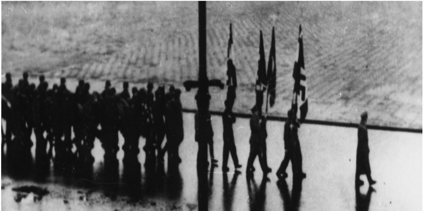
Fot. z zasobu IPN

https://przystanekhistoria.pl/pa2/tematy/zbrodnie-niemieckie/75235,Franz-Kutschera.html