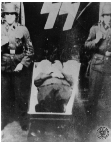
Trumna ze zwłokami kata Warszawy, dowódcy SS i Policji na Dystrykt Warszawa SS- Brigadeführera Franza Kutschery, podczas jego pogrzebu w Warszawie. Zdjęcie niemieckie.

I wreszcie następował akt ostatni, który miał złamać morale Polaków: nazwiska zamordowanych odczytywano przez szczekaczki, dodając na końcu imienną listę kolejnych zakładników. W krajobrazie miasta na stałe pojawiły się obwieszczenia z danymi zabitych i wybranych do egzekucji, drukowane na charakterystycznym ciemnoróżowym papierze.