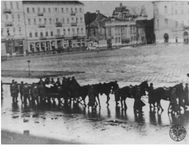
Trumna ze zwłokami Franza Kutschery na platformie ciągnionej przez trzy pary koni, Warszawa, pl. Saski.